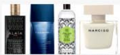
PARFUMS D'ÉTÉ 2015, QUE L'ON AIMERA ENCORE PORTER A LA RENTRÉE