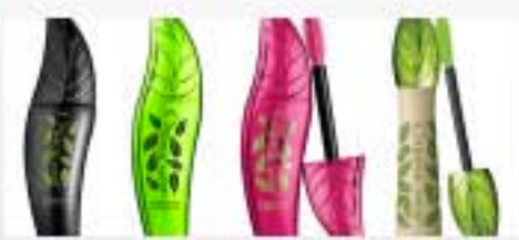
LES MASCARAS PHYSICIANS FORMULA MAQUILLENT ET STIMULENT LA POUSSE DE VOS CILS