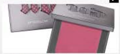
DU ROUGE HYPER-PIGMENTE SUR LES JOUES ? URBAN DECAY VOUS AIDE A BIEN APPLIQUER LES BIENNEES ACTEBOLOW