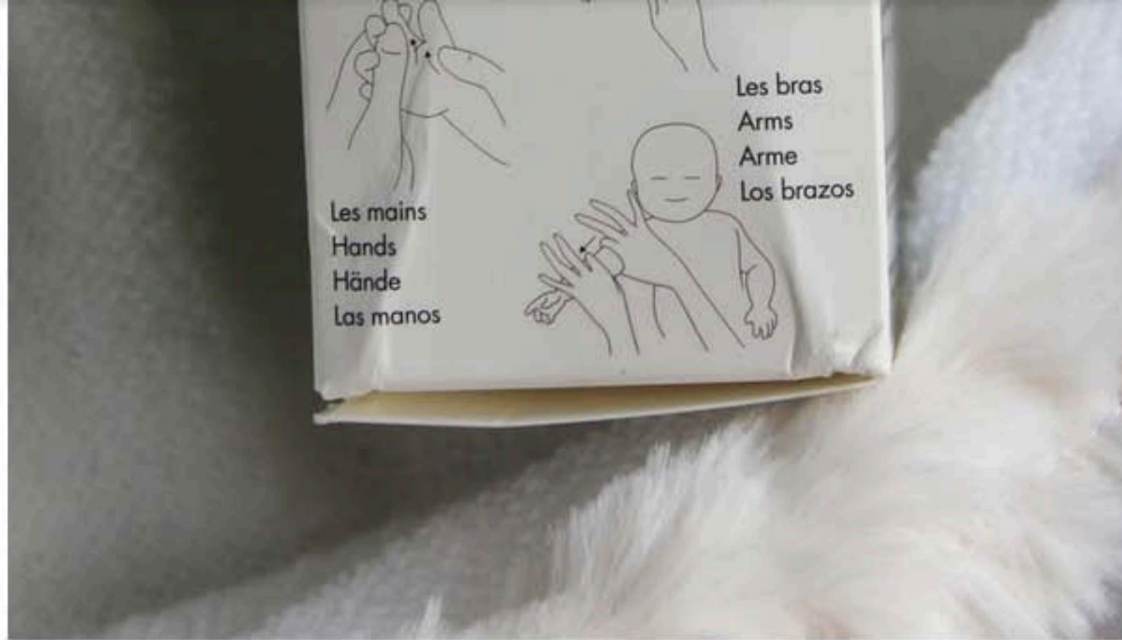
huile de massage Skin Haptics

L'huile de massage Skin Haptics est un vrai coup de cœur. Elle m'aide à détendre bébé tout en nourrissant sa peau qui est encore plus douce après le massage. Elle sent aussi très bon, un léger parfum de fruit. La composition me convient tout à fait et convient à la peau de ma fille qui la tolère très bien.