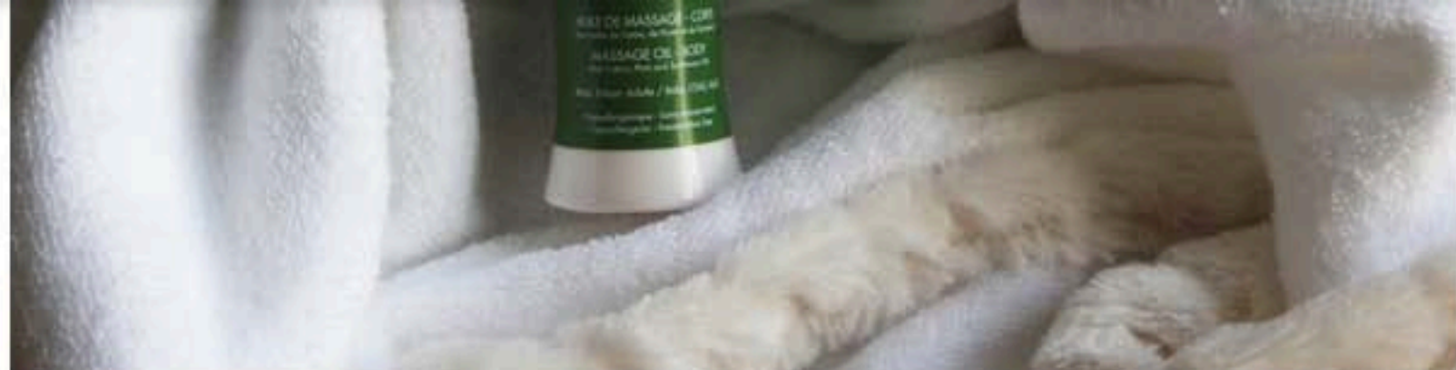
huile de massage Skin Haptics