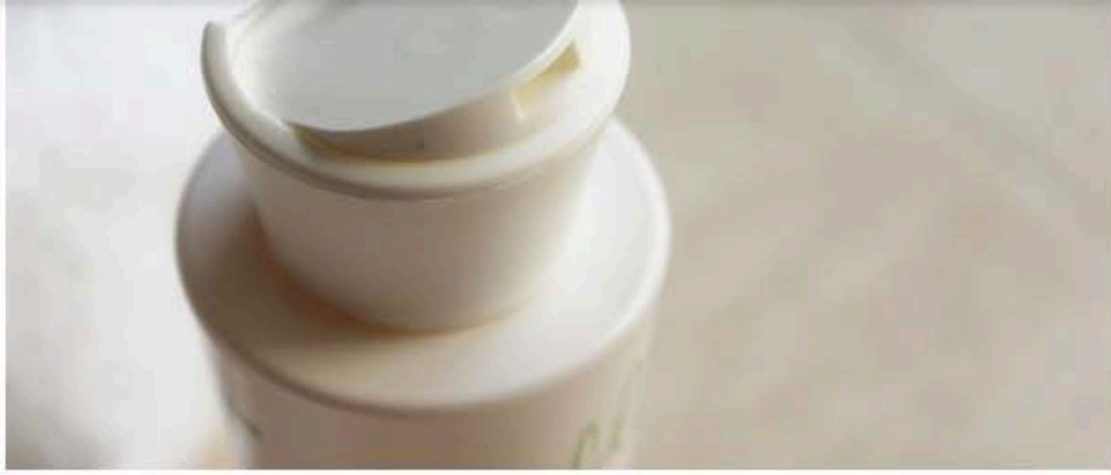
huile de massage Skin Haptics