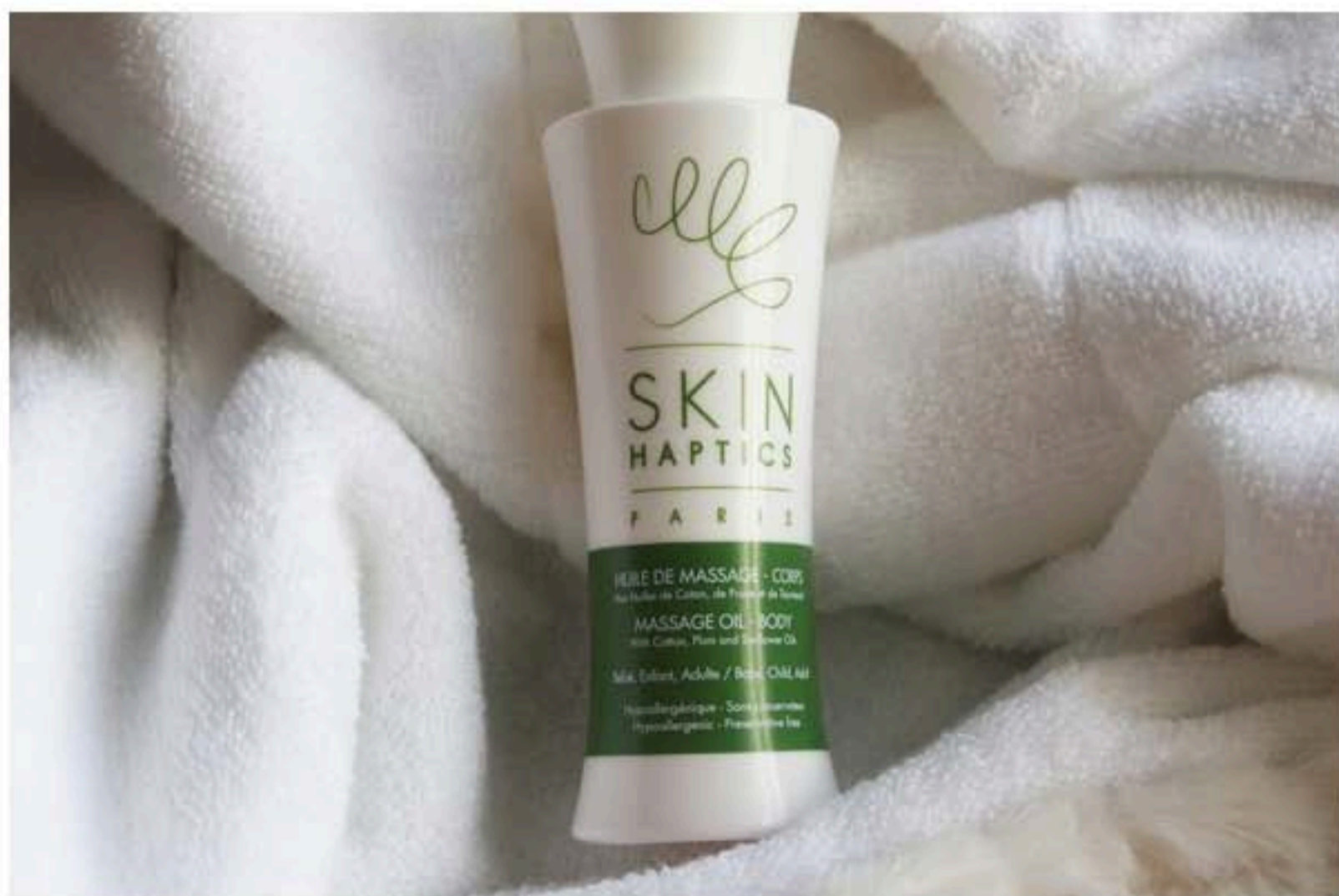
huile de massage Skin Haptics

Skin Haptics, qui signifie pour Skin, peau et Haptics, science du toucher , recommande l'utilisation de son huile de massage pour les peaux sèches, prévenir les vergetures, pour éliminer les croutes de laits et pour les massages.