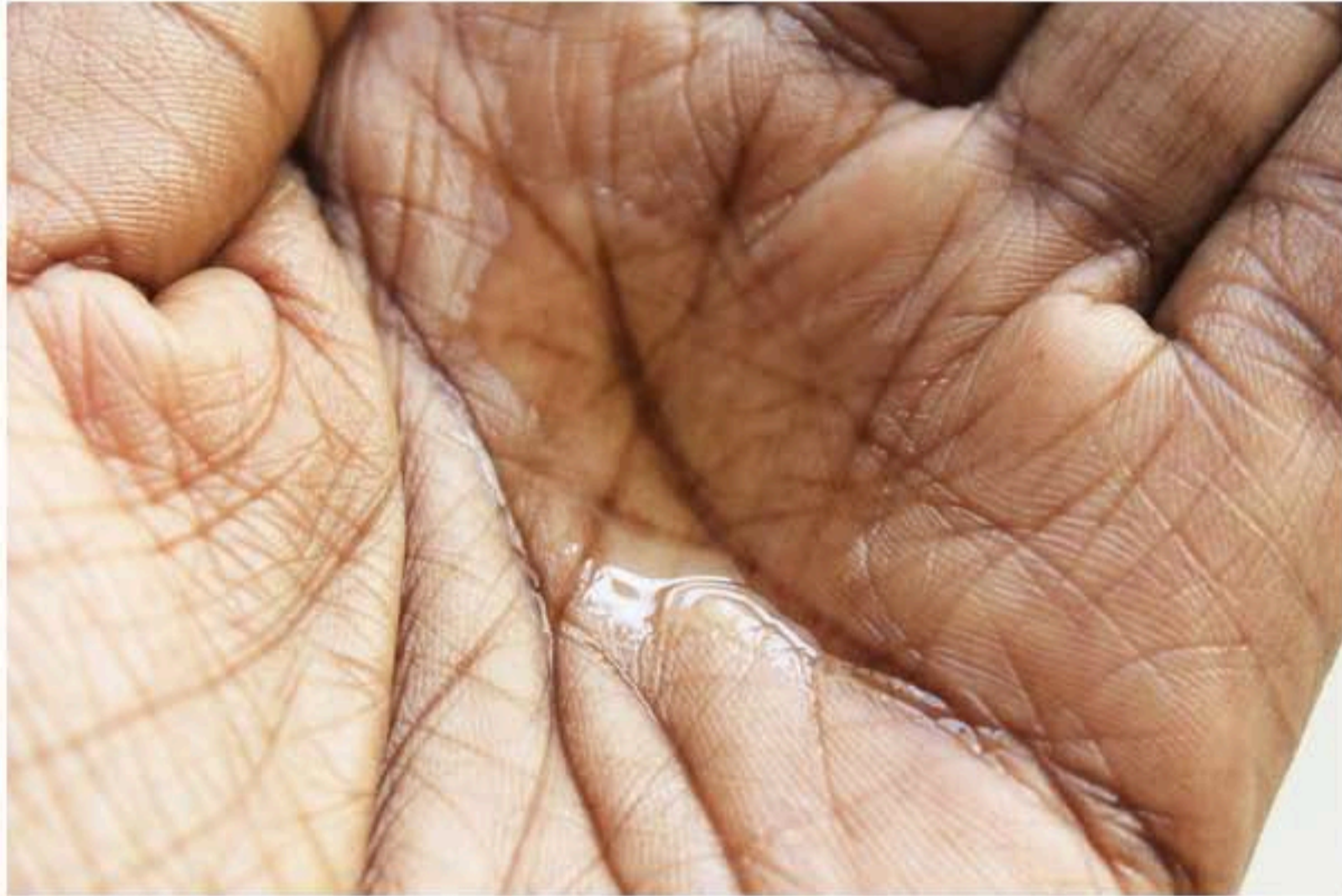
huile de massage Skin Haptics